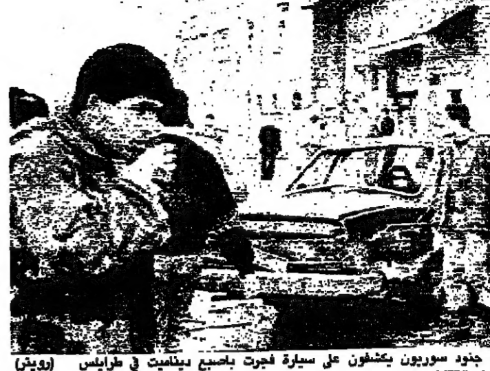
جنود سوربيون يتكشرون على سيارة لجنرت باصبع يمينيات في طرابلس

يقال الأسبوع السياسي على صرارة مرتفعة في بورصة المواقف المتشنجة والمرشحة الى المزيد من التشنج في الأسبوع المقبل انطلاقاً من عزيم كل طرف على الاندفاع في خطوته في اتجاه المواجهة، خصوصاً وان تدابير اهما مالمه قيد التنفيذ على الارض مما يجعل التراجع في المواجهة بعقبة كبرى للطرف الاخر. كل هذه المواقف والاستعدادات تتم، وسط التحضير لاجتماع اللجنة الثلاثية الوزارية التي تجتمع غداً في الجزائر، بحسب ما أعلنت وزارة الخارجية الجزائرية أمس، ويواجهها منوطها المتفرغ السيد الاخضر الابراهيمي الموجود في لبنان مساء اليوم أو صباح غد على ابعد تقدير. بعد ان يكون قد أنهى جولة استطلاعية مع المسؤولين والقيادات في لبنان، ويحمل حصيلة ارائهم ومطلبهم الى الاجتماع المذكور في الجزائر. واشارت اوساط مطلعة ان اللجنة العربية الوزارية ستضمن تقريرها المقبل اعترافاً بوجود رسالة خطية على هامش اتفاق الطائف، مع مضمون تتعهد فيها الحكومة السورية بسحب قواتها من لبنان عملاً بمضمون هذا الاتفاق، وكان الرئيس الراحل الهراوي قد أكد امس، ان الحكومة ستكون حازمة في تنفيذ قراراتها، وان جولته العربية ستكون بعد اجتماع اللجنة العربية، والقرارات التي ستصدر من هذا الاجتماع. في هذا الوقت اشارت اوساط سياسية شرقية، الى ان اي كلام على اعادة احياء الطائف، هو مضيقه لوقت ولوقت الى ان مسألة التدابير الادارية والمالية هي سبب ذو حدين، مؤكداً ان حكومة العماد عون ستكون لها ايضا قرارات للمواجهة على هذا الصعيد، معتبرة ان الحرب السياسية مهما بلغت ذروتها، يجب ان تكون